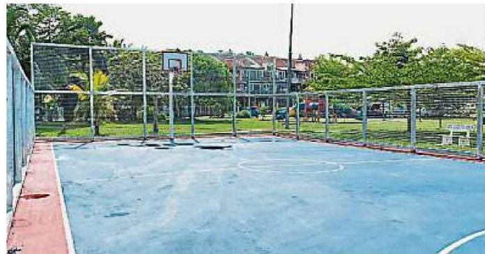
雪州政府拨款维修的篮球场, 让居民有个更舒服的活动空间。