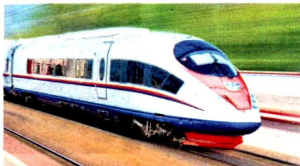
JAJARAN Selangor Selatan ECRL akan melalui Sepang-West Port, manakala Jajaran Utara pula akan melalui Gombak-Serendah-Pelabuhan Klang.

Menurutnya, penangguhan persetujuan Selangor akan dibawa ke mesyuarat Kabinet dalam masa terdekat supaya satu keputusan boleh dicapai.