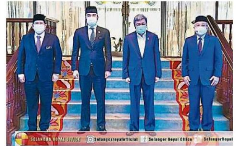
雪州苏丹沙拉弗丁(右二起)与王储东姑阿米沙,在沙亚南王宫接见阿汉峇峇(右一)和莫哈末沙菲克的到访与最新资讯。