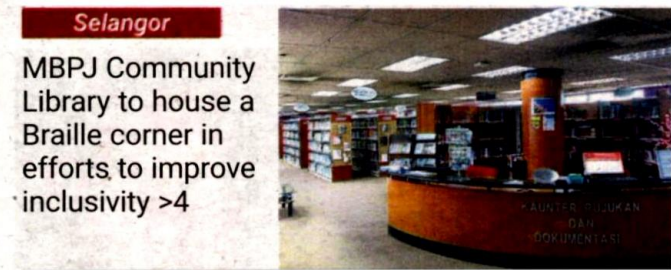
MBPJ Community Library to house a Braille corner in efforts to improve inclusivity >4