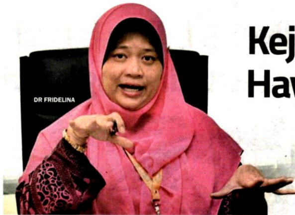
Graduan UNISEL diiktiraf di peringkat dunia