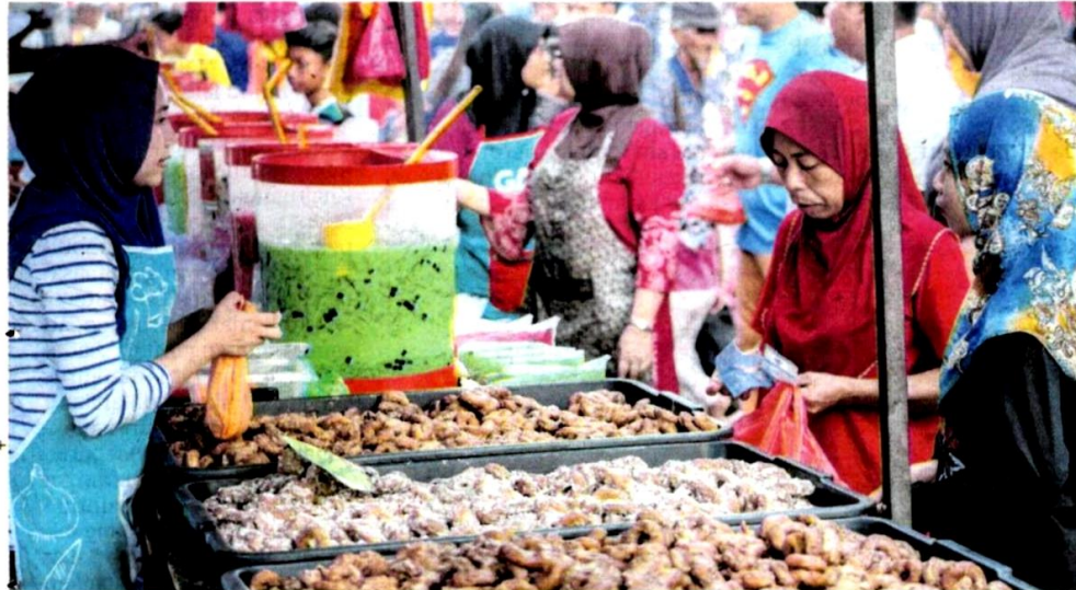
BAZAR Ramadan tahun ini perlu mematuhi prosedur operasi standard (SOP) yang lebih ketat bagi membendung penularan jangkitan Covid-19.